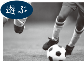
母畑レークサイドセンター

阿武隈地域の豊かな緑と清らかな水の流れなどの美しい自然に包まれ、長い歴史と伝統を伝承しながら石川町には、訪れる人を飽きさせない魅力があります。